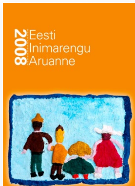
Eesti inimarengu aruanne 2006 esikaas.

„Kui aasta tagasi valiti seda raportit välja andva Eesti Koostöö Kogu poolt tänavuse inimarengu aruande läbivaks teemaks elukvaliteet, olid silme ees rõõmsamad väljavaated Eesti elu paremaks muutumisest. Ometigi peame elukvaliteedile mõtlemist eriti oluliseks uues olukorras, kui on selge, et raha on mullusest vähem nii riigi kui pere eelarves. Just nüüd on vaja eriti täpselt vaagida, mis on elus kõige olulisem. /---/ Kuid ühistest muredest rääkides on autorid samal ajal toonud lugejate ette pildi kiiresti arenenud ühiskonnast, mis jõudis viimaste aastate jooksul oma heaolu taseme, infokülluse, eluviisi ning eluga rahulolu määra poolest peaaegu järele sellele „läänelikule elustandardile“, mis kümme aastat tagasi tundus veel kauges ja kättesaamatu. (EIA 2008, lk 9)