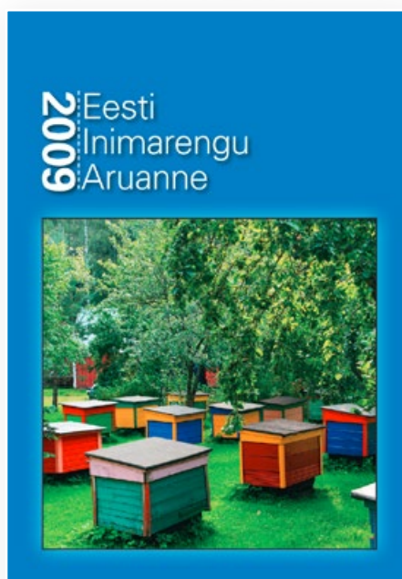
Eesti inimarengu aruanne 2009 esikaas.

2009. aasta globaalses inimarengu edetabelis seisab Eesti endiselt 40. kohal, Euroopas aga jätkuvalt 25. kohal. Seekord on UNDP jaganud kõrgema arengutasemega riigid kaheks rühmaks, väga kõrge (38 riiki) ja kõrge inimarengu tasemega riikideks (45). Peale nende eristatakse keskmise ja madala arengutasemega riike (vastavalt 75 ja 24). Eesti jääb oma koondnäitajaga (0,883) napilt allapoole maagilist väga kõrge inimarengu taseme määra (0,900). Ida-Euroopa uutest EL-i liikmesriikidest kuuluvad väga kõrge arengutasemega riikide hulka ainult Sloveenia ja Tšehhi.